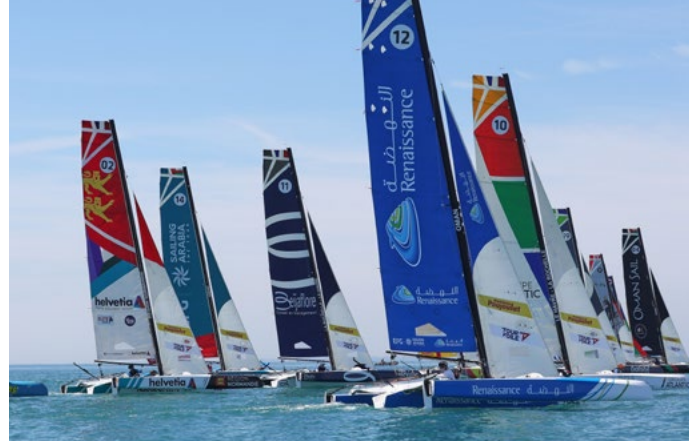
TOUR VOILE 7 TOUR VOILE 2019 - DU 05 AU 21 JUILLET 2019 - PHOTO : JEAN-MARIE LIOT / ASO

“Serre-Ponçon, c’est l’un de ces spots que l’on choisit afin de travailler. Nous pouvons millimétrer nos entraînements physiques grâce à la diversité des activités qu’offre cette nature omniprésente et ce lac qui chaque après-midi nous offre du thermique à coup sûr pour naviguer dans de supers conditions !”