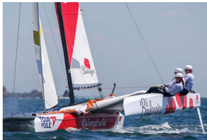
TOUR VOILE 7 TOUR VOILE 2019 - DU 05 AU 21 JUILLET 2019