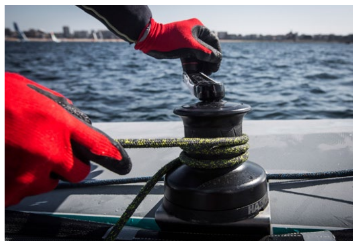
TOUR VOILE 7 TOUR VOILE 2019 - DU 05 AU 21 JUILLET 2019