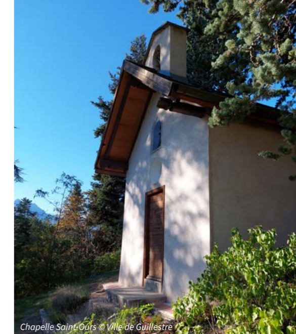
Chapelle Saint-Ours