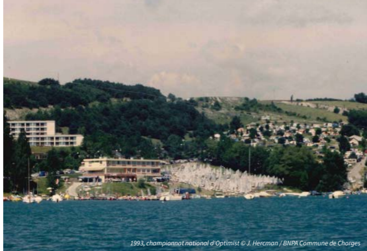
1993, championnat national d'Optimist

Inaugurée en 1898, l'ancienne salle de classe permet de « raconter » l'histoire de l'instruction dans le Queyras (XVII e -XX e siècle). Adapté aux familles. Org. Quey'racines